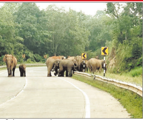
नेशनल हाईवे में अक्सर इस तरह हाथियों का झुण्ड आता है नजर।