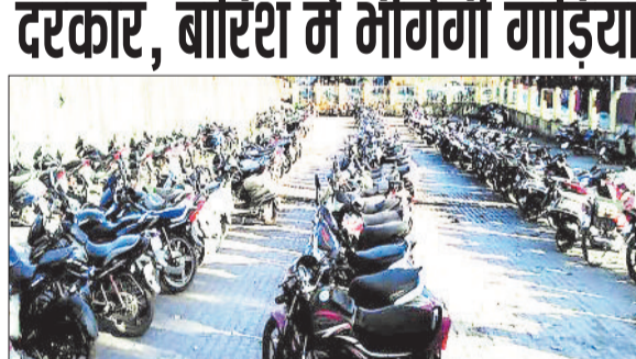
वाहन स्टैंड में खड़ी गाड़ियां।