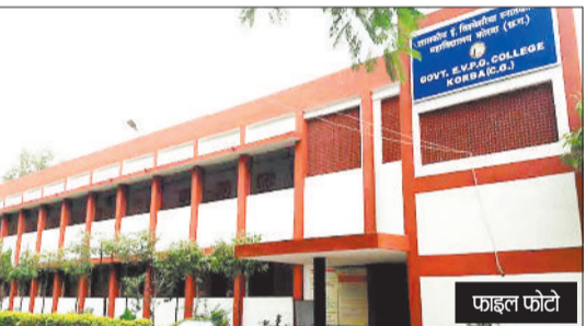
हरिभूमि न्यूज || कोरबा

उच्च शिक्षा विभाग ने सत्र 2024-25 से राष्ट्रीय शिक्षा नीति लागू करने की घोषणा कर दी है। विभाग ने इसे लेकर सभी विवि को पत्र जारी कर दिया है। इसमें कहा गया है कि स्नातक में सेमेस्टर पद्धति से प्रवेश होगा। बीए, बीएससी, बीकॉम, बीसीए और बीबीए में एनईपी लागू होगा। इन विभागों में प्रवेश लेने वाले छात्रों को गुप विषय के अनुसार ही प्रवेश दिया जाएगा। इसके साथ ही छात्रों को एन्हासमेंट कोर्स, वेल्यूर एडज कोर्स और